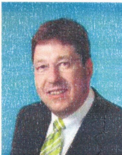
Heinz-Werner Windhorst Bürgermeister der Stadt Aurich